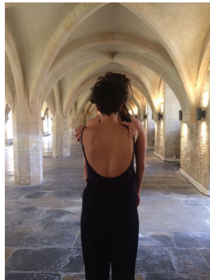
version hors plateau/ pénombre